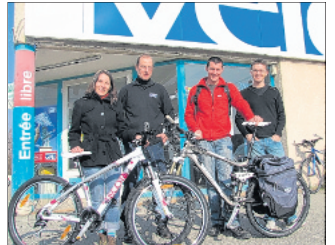
L'Amérique du Sud à VTT, tout un programme.

tériel). Ils ont besoin de produits bien ciblés pour affronter différents chemins et des changements probables de météo. » Là-bas, ils comptent également manger et dormir chez l'habitant : « On fait partie d'un réseau social qui propose d'offrir le gîte et le couvert à des cyclistes, et on peut être accueillis dans le monde entier. » Le budget prévu par jour est donc de 10 € par personne : un petit prix pour un grand voyage, à suivre sur leur blog www.skyroule.wordpress.com jusqu'au 15 juin prochain... Véronique GRAILLAT-JOLY