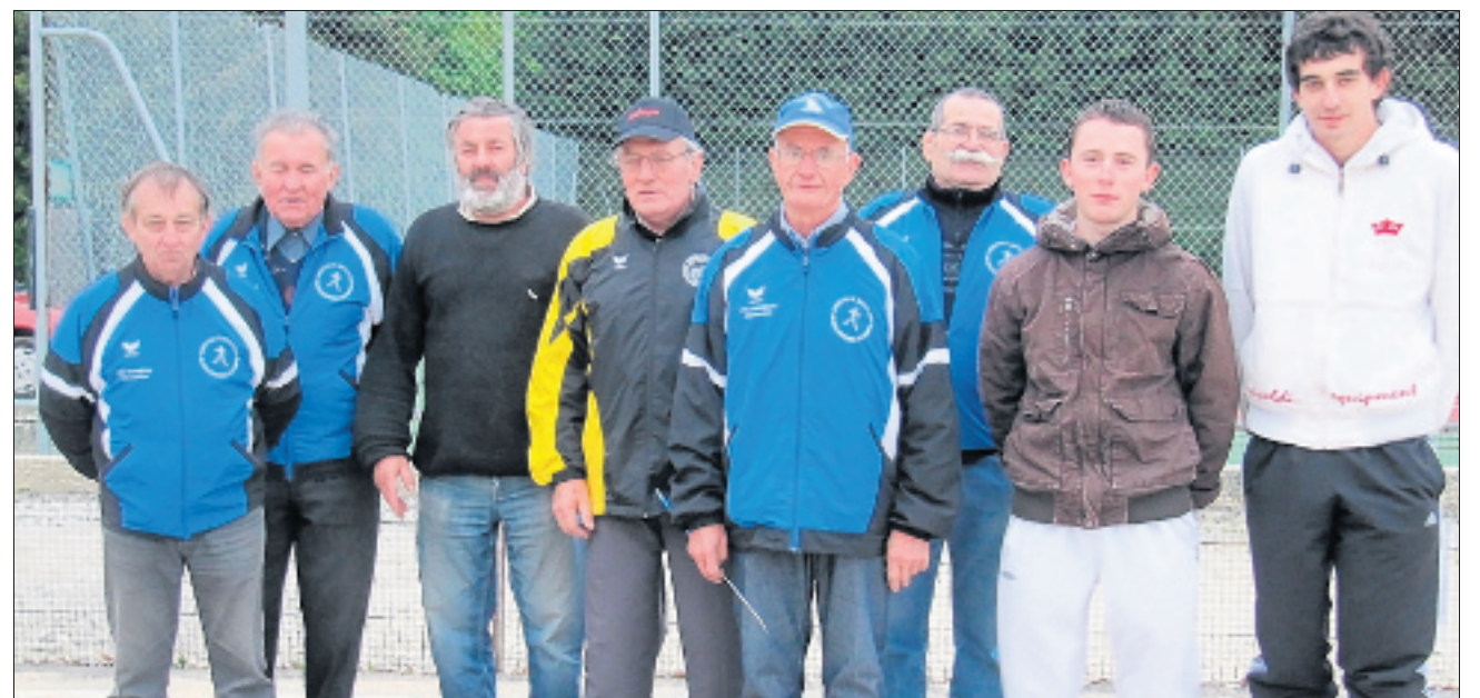
Les boulistes ont fait le point.